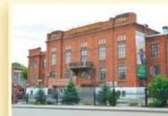
1-й уч. корпус ул. Куйбышева, 30 ГОРНОМЕХАНИЧЕСКИЙ ФАКУЛЬТЕТ ФАКУЛЬТЕТ ГОРОДСКОГО ХОЗЯЙСТВА