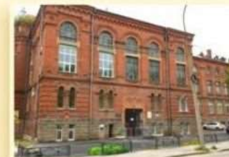
2-й уч. корпус пер. Университетский, 9 ГОРНОТЕХНОЛОГИЧЕСКИЙ ФАКУЛЬТЕТ