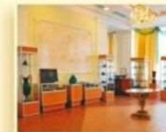
Уральский геологический музей ул. Хохрякова, 85