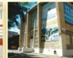
Дом спорта УГГУ ул. 8 Марта, 84А