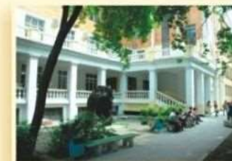
3-й уч. корпус ул. Хохрякова, 85 ФАКУЛЬТЕТ ГЕОЛОГИИ И ГЕОФИЗИКИ