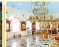
Храм Святителя Николая Чудотворца ул. Куйбышева, 39