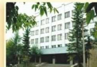
4-й уч. корпус пер. Университетский, 7 ИНЖЕНЕРНО-ЭКОНОМИЧЕСКИЙ ФАКУЛЬТЕТ